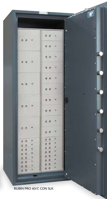
RUBIN PRO 60/C CON SLK