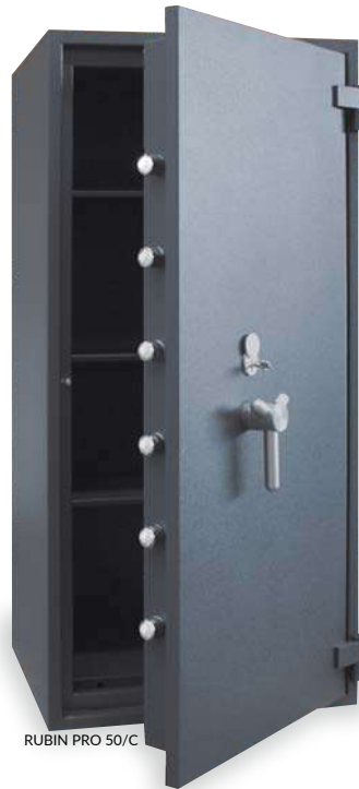
RUBIN PRO 50/C