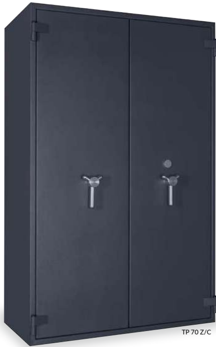
TP 70 Z/C